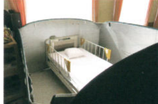
日赤 災害物資支援