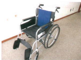
社協 介護用具貸し出し