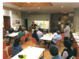
社協 志民活動応援