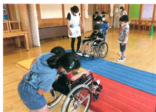
社協 学校での福祉学習