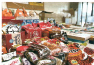
共募 フードバンク