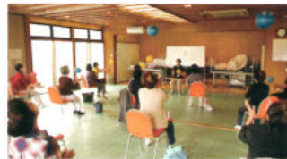
社協 はつらつ運動教室