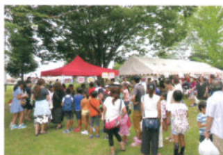
共募 自治会活動への助成