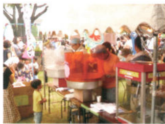
社協 イベント機材貸し出し