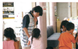
共募 サマーボランティア