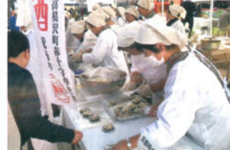
日赤 炊き出し訓練