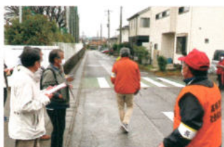
共募 防災まち歩き