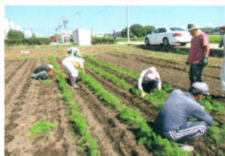
社協 民協農園の支援